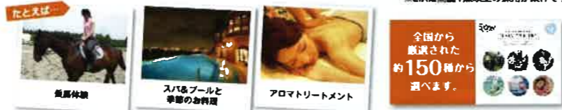
たとえば、 乗馬体験