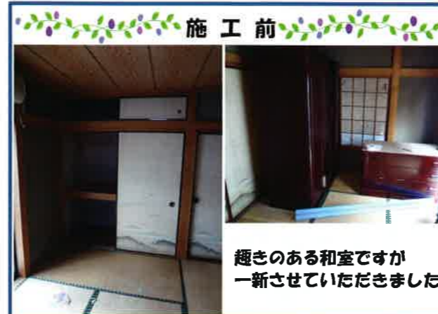
趣きのある和室ですが一新させていただきました!