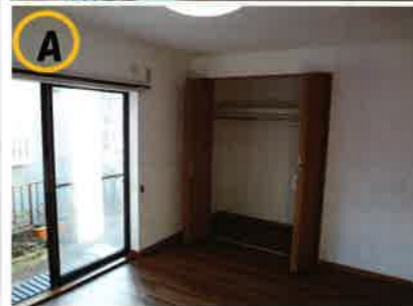
白いクロスがよりお部屋を明るくします