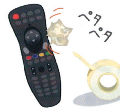
リモコンのボタンとボタンの間はセロハンテープの粘着面を表にして丸め、ベタベタしてもキレイになりますよ！

雑菌の繁殖を防ぐために、プラスチック製も木製も洗剤で洗ったら熱湯消毒がベスト。切った跡が残っている場合は塩をすり込んで洗うと、塩がその跡に入り込んで雑菌を除去してくれます。そして乾燥を。短時間、天日干しするといいですよ。木製まな板は傷が多くなってきたらサンドペーパーなどで削るとキレイ