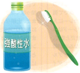
強酸性水で歯ブラシを軽く洗っても除菌に！最後は念のため水道水ですすぎを。強酸性水はホームセンターで手に入ります。

毎日使うもので、使用後、水洗いしてもブラシ部分が細かいので食べかすがそのまま残ってしまうケースがありますので、水洗い後はよく確認して、あれば取り除いてください。たまたま熱湯にしばらくつけるなどして清潔を保ち、1カ月に1度は交換を。また、乾燥もとても大事。棚の中にしまう場合は、しばらくはコップなどに差してよく乾かしましょう。