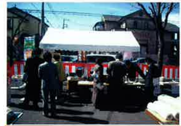
去年のフェア風景