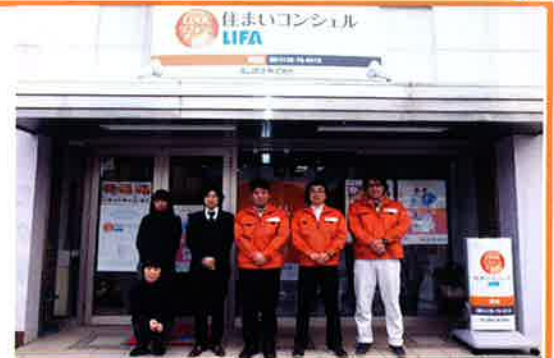
スタッフ一同お待ちしております！